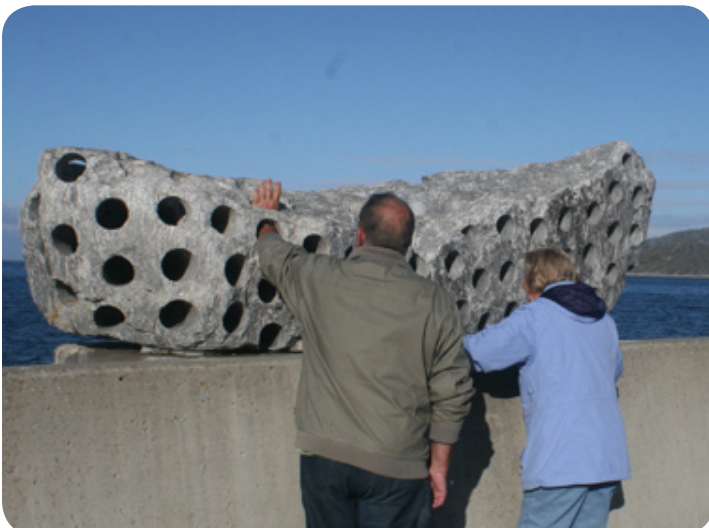
Sculptuur in het landschap.