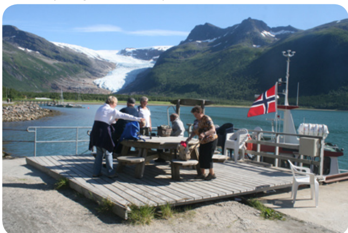
Picknicken met uitzicht op de Engenbreen gletsjer bij Glomfjord.

Oude vishaken, glazen boeien, een walvstrand, een telefooncentrale, munten, modelboten en echte authentieke vissersboten. Kortom alles wat te maken heeft met het leven op Leka. De paar gebouwtjes zijn te klein om alles ordentlich uit te stellen. De muren hangen vol met gebruiksvoorwerpen keurig voorzien van een label. De boten, sleeën en karren staan kriskras door elkaar. En dat maakt het extra leuk. Het bezoek aan het museum heeft alles weg van een zoektocht op een antiekmarkt.