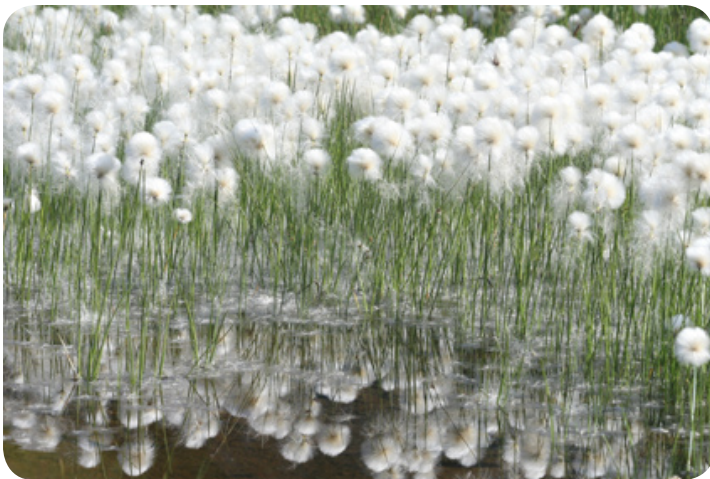
Het veenpluis in bloei.