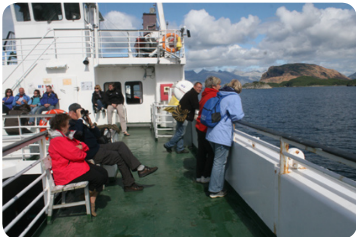
Met de ferryboot gaan we over de poolcirkel.