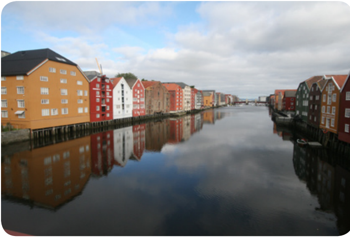
De kleurrijke huizen in de haven van Trondheim.