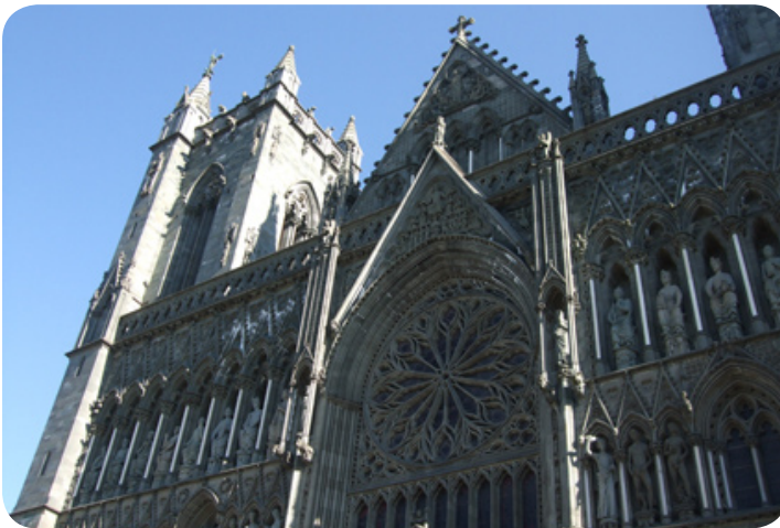
De Nidaros kathedraal.