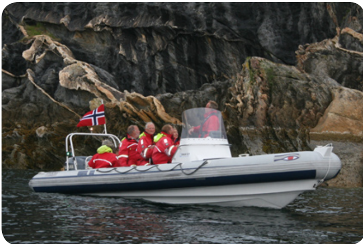
We gaan varen op de Saltstraumen.