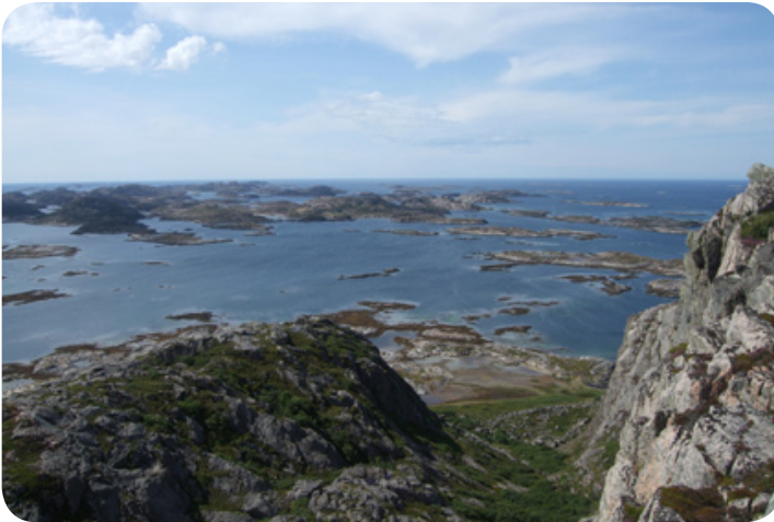
Honderden kleine eilandjes voor de kust van Vikna.