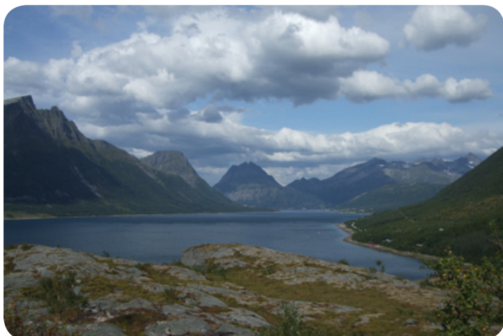
Eén van de vele panorama's langs route 17.