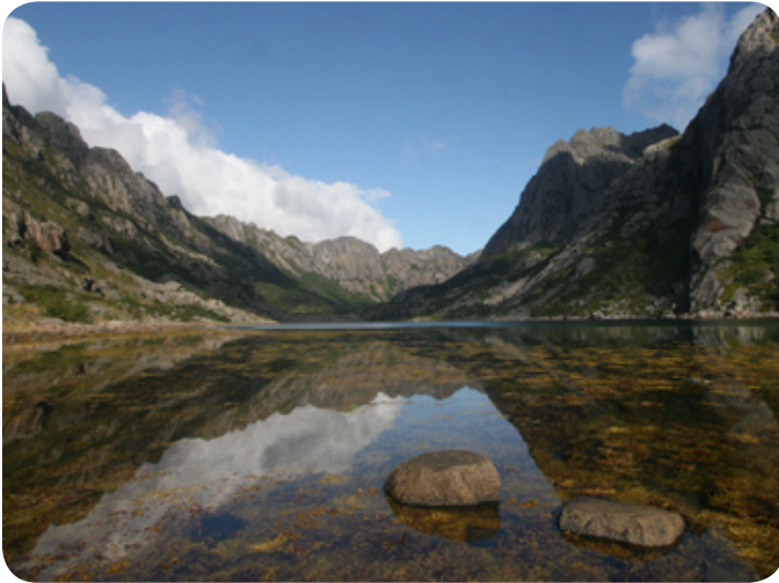
De prachtige natuur van Noorwegen.