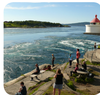
De stroomversnelling in Saltstraumen.