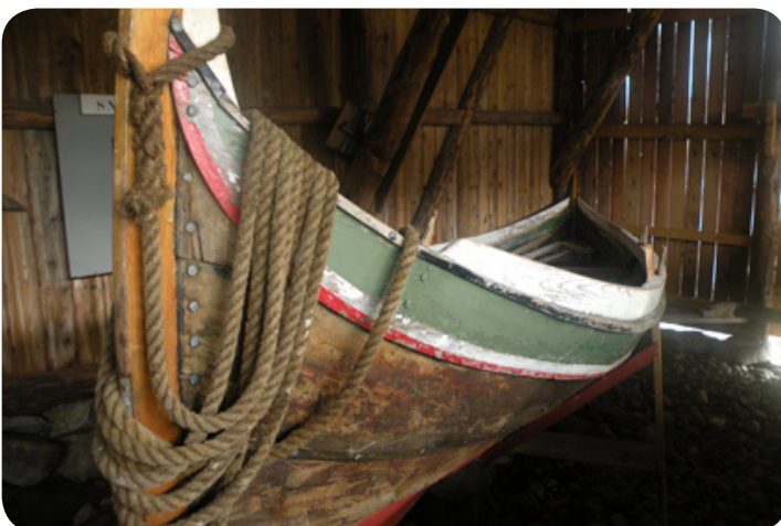
Een oude visserboot in het dorpsmuseum.