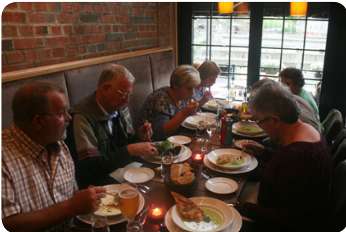
Tijdens het welkomstdiner in Trondheim.