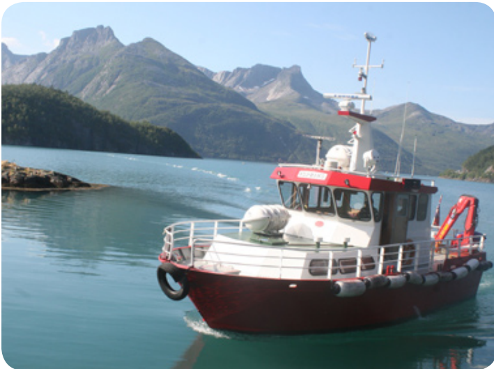
Boottochtjes zijn onmisbaar tijdens onze reis door Nordland.