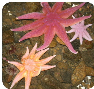
Zonnesterren in het water.