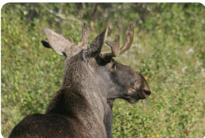
De eland, koning van het Noorse bos.