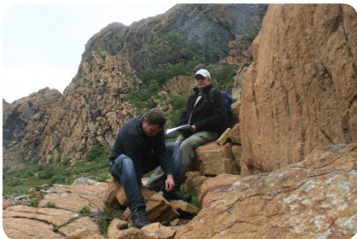
De goudkleurige steenmassa's op Leka.