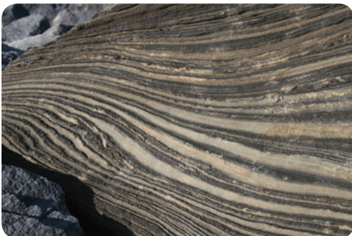
De afgesleten rotsmassa bij de dammen.