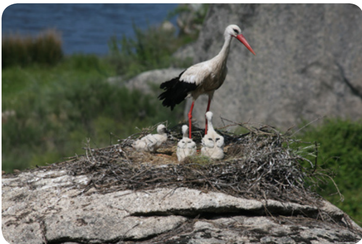
De ooievaars broeden op rotsen in Los Barruecos.

Aan het einde van de dag maken we nog een stop bij een van de ruïnes aan de rand van het gebied in de hoop de zwarte tapuit te kunnen vinden.