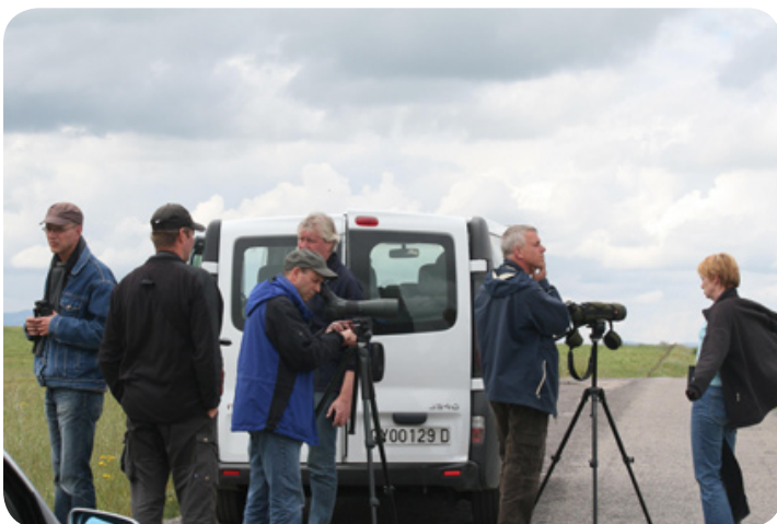
Op zoek naar steppevogels.

Langzaam maar zeker zakken we af naar de steppen van Bélen op zoek naar bijzondere soorten als de grote en de kleine trap en de griel maar ook de kuifleeuwerik en de theklaleeuwerik zitten vaak rustig op een paaltje langs de kant van de weg. Regelmatig wordt hier ook de kuifkoekoek gesignaleerd.