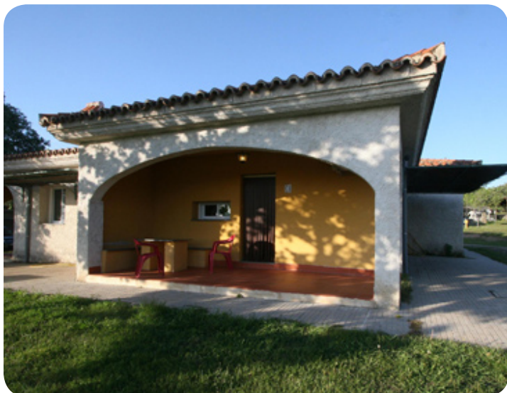
Eén van de bungalows.

In Villafáfila kiezen we voor een comfortabel hotel dicht bij het natuurgebied en de zoutvlaktes.