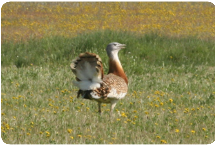
De grote trap.

Via landelijke paadjes gaan we op weg naar het waterrijke gebied aan de rand van het Embalse Arrocampo Almarez. We rijden door het glooiende landschap met graslanden en eikenbomen waar de zwarte wouw in de lucht cirkelt en de ooievaars lopen te foerageren door het grasland. Onderweg maken we ook nog kans op de grijze wouw en de bijeneter. Eenmaal bij het embalse gaan we op zoek naar riet- en watervogels zoals de purperkoet, de cetti's zanger en de purperreiger. Tijdens het kijken en observeren hebben we hier een picknick. Daarna rijden we verder naar het nationaal park Monfragüe. Het park staat bekend voor zijn grote groepen vale gieren maar de mogelijkheid bestaat dat we ook andere soorten als de aasgier en de zwarte ooievaar zien. We stoppen bij de belangrijkste uitkijkpunten en beginnen bij de 'Portilla de Tiétar'. Vanaf het uitkijkpunt aan de andere kant van de rivier kunnen we de vale gieren prachtig observeren. We volgen de rivier naar het volgende punt 'La Tajadilla' waar het schouwspel zich herhaalt. Aan het einde van de middag komen we dan aan bij het laatste punt van de dag; de 'Peña Falcón'. Deze rots is wel de meest bekende van het nationaal park. Aan de andere kant van de Taag kunnen we een grote kolonie vale gieren op hun nesten zien. We wachten rustig af wat er allemaal gaat gebeuren want maar al te vaak zien we de gieren opstijgen en op de thermiek voorbij zweven.