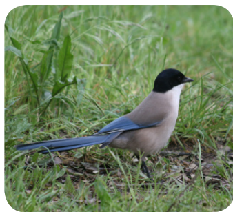
De blauwe ekster.