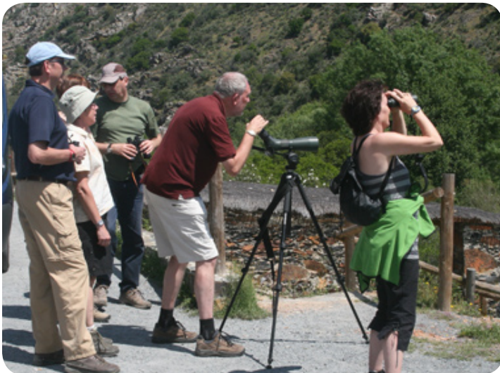
Vogels spotten in het park.