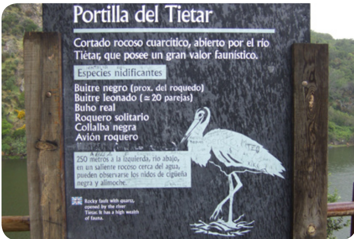
Portilla del Tiétar, één van de bekende uitkijkpunten in het park.