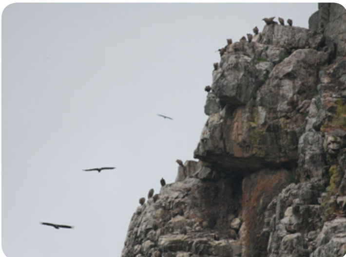
De Peña Falcón.