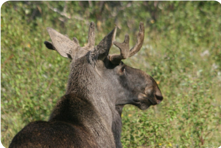
De eland, koning van het Noorse bos.