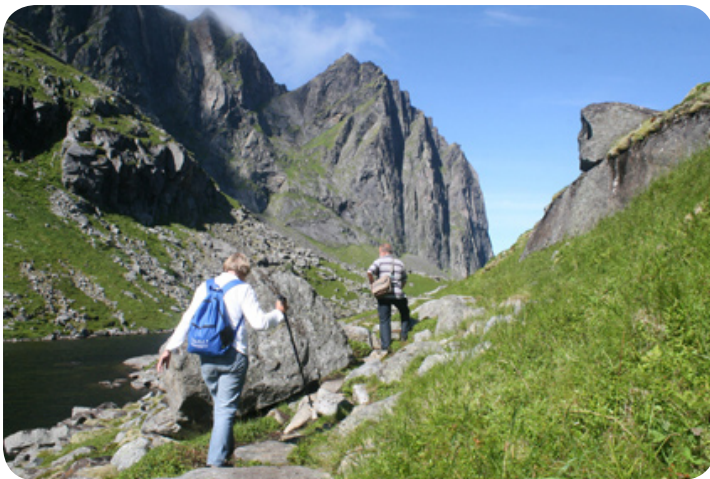
Tijdens de wandeling naar Kvalvik.