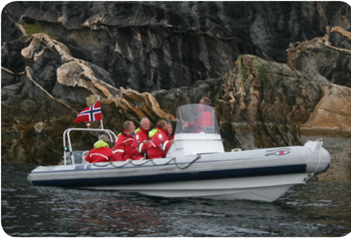
We gaan varen op de Saltstraumen.

Op de terugweg bekijken we enkele kunstwerken uit het Skulpturlandskap Nordland. We verlaten de doorgaande weg om verder het 'binnenland' in te komen en hebben nog een korte pauze bij het strand van Haukland, één van de mooiste stranden van de Lofoten.