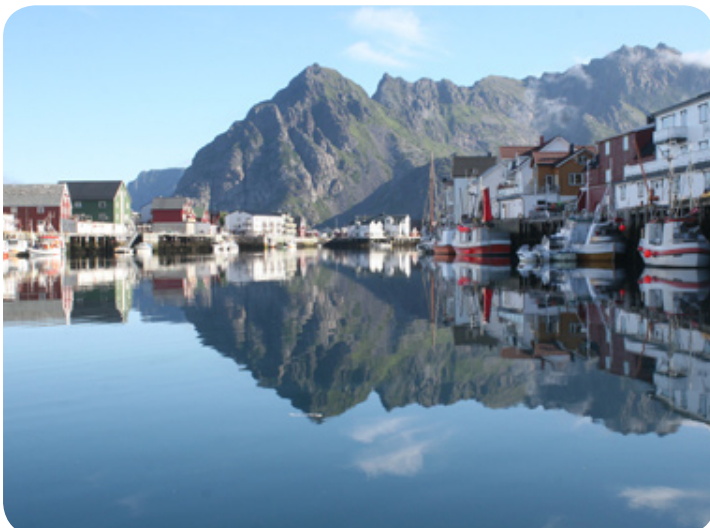
De haven van Henningsvaer.