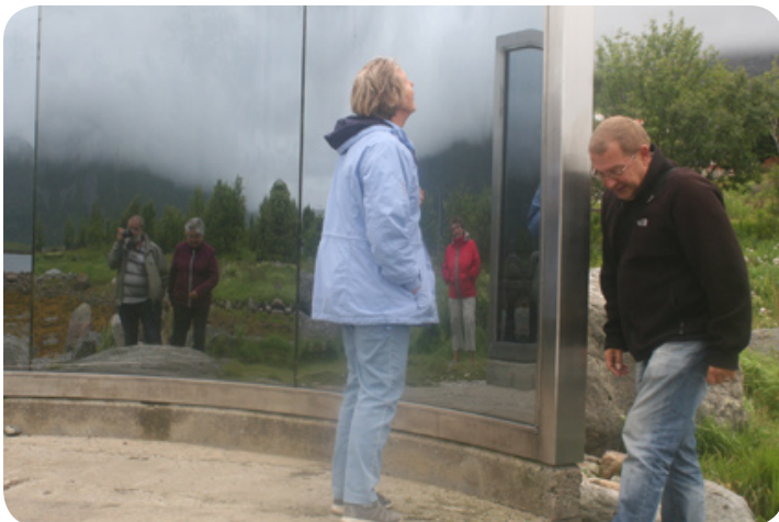
Eén van de sculpturen op de Lofoten.