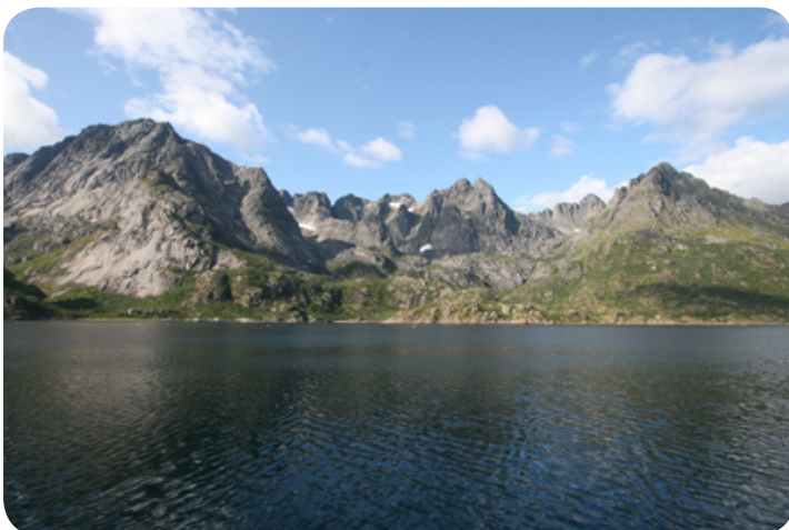
Op weg naar de Trollfjord.