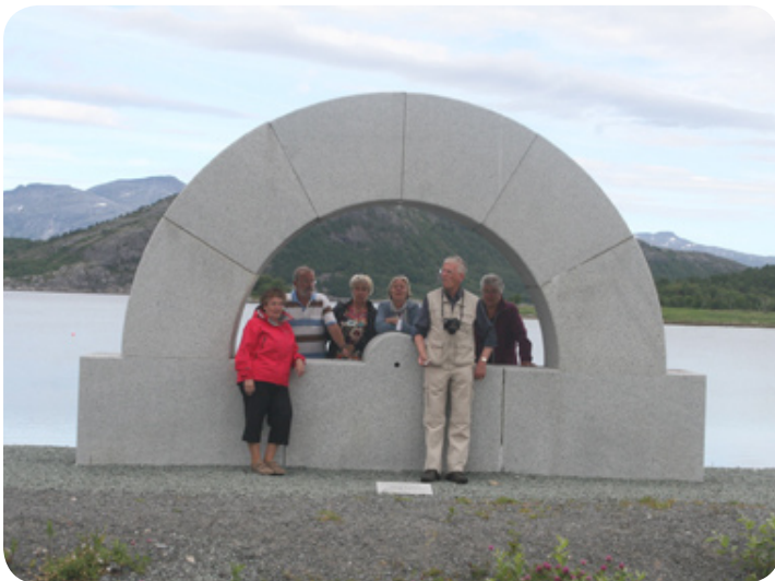
Sculptuur in het landschap.