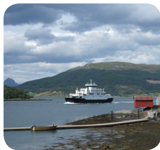
De ferryboot is onmisbaar in Noorwegen.