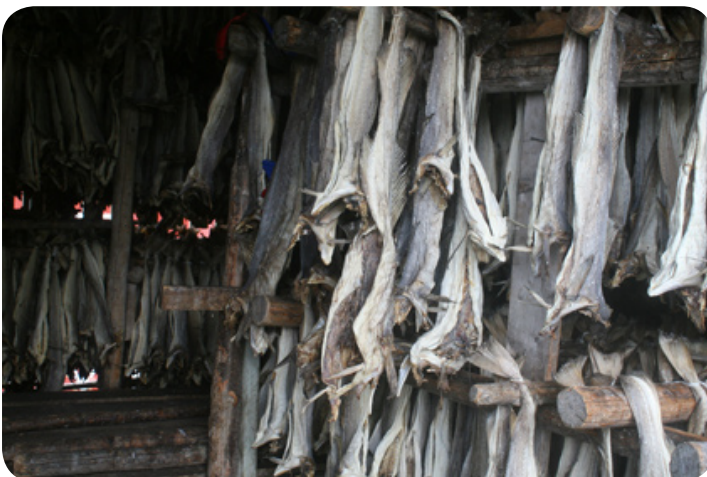
De kabeljauw hangt te drogen.