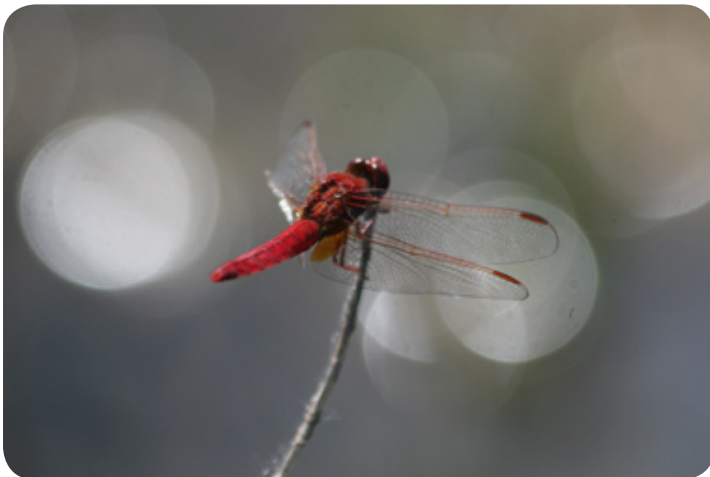
De vuurlibel (man).