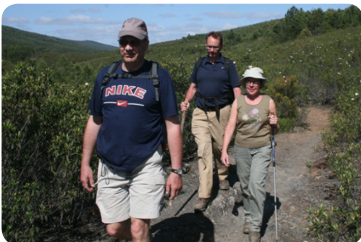
Wandelen door het park.