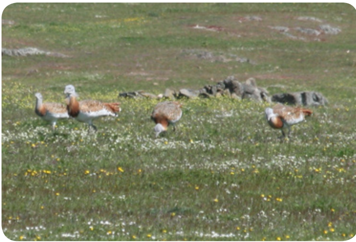
Een groepje grote trappen.

Vanaf ons logeeraadres duiken we meteen de binnenlanden in. Hier loopt een prachtige zandpad over de Sierra de Santa Catalina naar Serradilla. Dit rustige, nagenoeg ongebruikt, pad biedt een grote diversiteit aan bloemen en vogels. Er is bijna geen ander verkeer dus we hebben alle mogelijkheden om rustig te stoppen, rond te kijken en te observeren. We maken kans op de roodkopklauwier, de hop of de tapuit. Maar de dwergarend, de slangarend of de rode wouw laten zich hier graag aanschouwen zwevend over de velden op zoek naar voedsel.