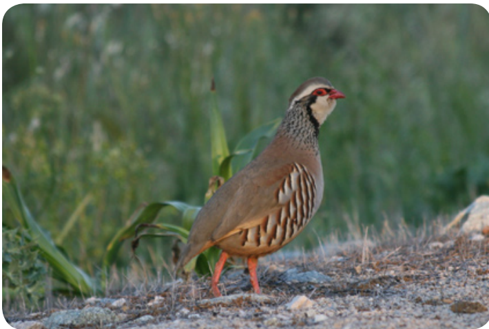
De rode patrijs.