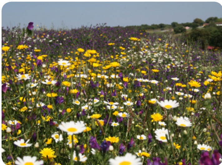
Een zee van bloemen.