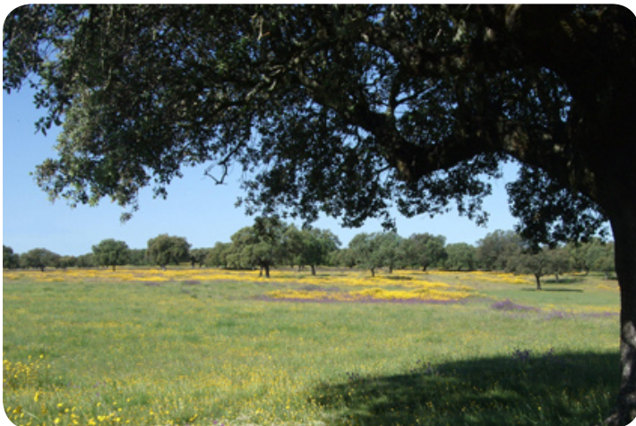
Het landschap van Extremadura; velden met bloemen en eikenbomen.