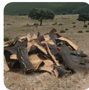
De kurk van de kurkeik gehaald.