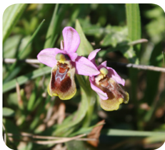
De wolzwever orchis.