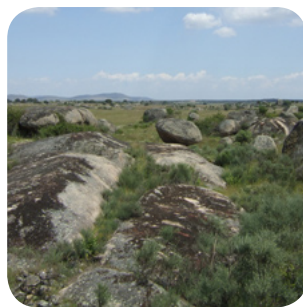
Het landschap van Los Barruecos.