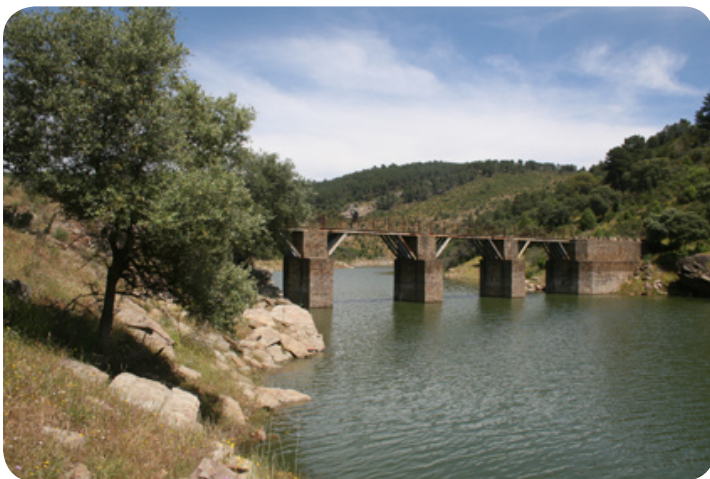
De brug over de arroyo de Barbaón.